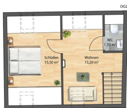
Haupthaus Top 4 56,50 m 2